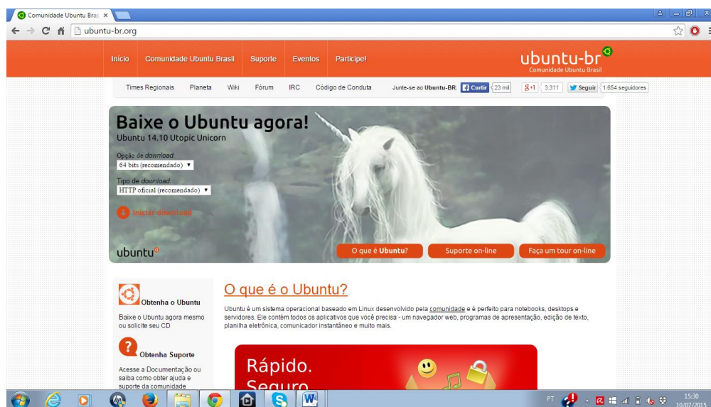
Figura 1 - Página eletrônica do Ubuntu

A fonte deve ser menor que a usada no texto, e em negrito; sugere-se usar Times New Roman ou Arial 10. A ilustração deve ser inserida o mais próximo possível do texto que a refere e deve ser mencionada no texto.